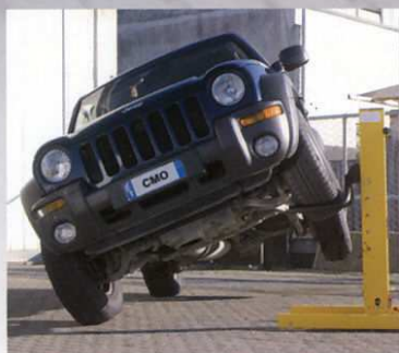
Sollevamento su ruote anteriori Lifting on the front wheel