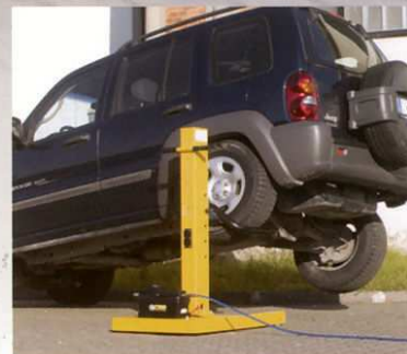
Sollevamento su ruote posteriori Lifting on the rear wheel