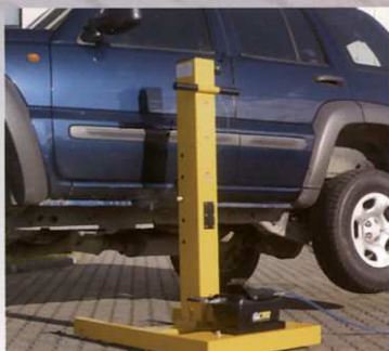
Sollevamento su sottoporta Lifting on the underdoor